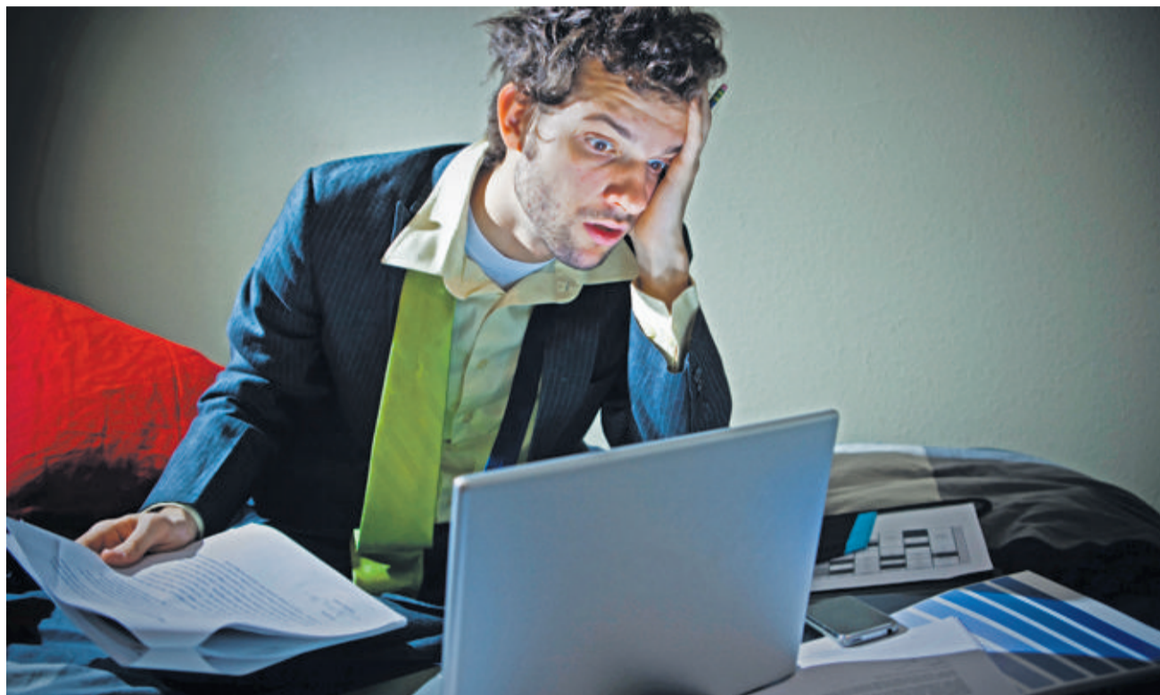
Stress et burn-out guettent les employés qui ne parviennent pas à décrocher de leur travail. Sans parler du risque d'erreur. Todd Keith

L'idée a été émise par les représentants du personnel, soucieux de voir leurs collègues stressés même à la